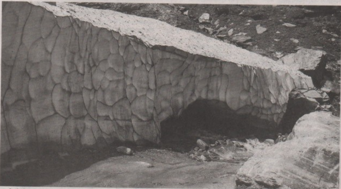
നദിയിൽ ഒഴുകിവന്ന മഞ്ഞുമല

ഷിംലയിൽനിന്നു നേരേ എതിർവഴിയിൽക്കൂടി സഞ്ചരിച്ചു രാംപൂർ വഴി കിന്നർ ജില്ലയുടെ ആസ്ഥാനമായ റിക്കോങ് പിയോയിൽ എത്താം. ഇവിടെനിന്നു നാക്കോ വഴി ദുർഘടമായ മലമ്പാതകളിൽക്കൂടി യാത്ര ചെയ്താൽ സ്പിതിയുടെ ആസ്ഥാനമായ കാസയിൽ എത്തിച്ചേരാം. നാനൂറിലധികം കിലോമീറ്റർ ദൂരമുള്ള ഈ വഴിയും ബുദ്ധിമുട്ടേറിയതാണ്. ജൂൺ മാസത്തിനു ശേഷമാണെങ്കിൽ കാസയിൽനിന്ന് ലാഹൂളിന്റെ ആസ്ഥാനമായ കിലോൺവരെ പോകാം. അവിടെനിന്ന് റോത്തഞ്ച് ചുരം-മനാലി-കൂളു വഴി ഷിംലയിൽ എത്തിയാൽ ഹിമാചൽപ്രദേശിനെ ഒന്നു പ്രദക്ഷിണം വെച്ചുപോലെയായി കാസയിൽനിന്നു പത്തു കിലോമീറ്റർ ദൂരെയുള്ള പു