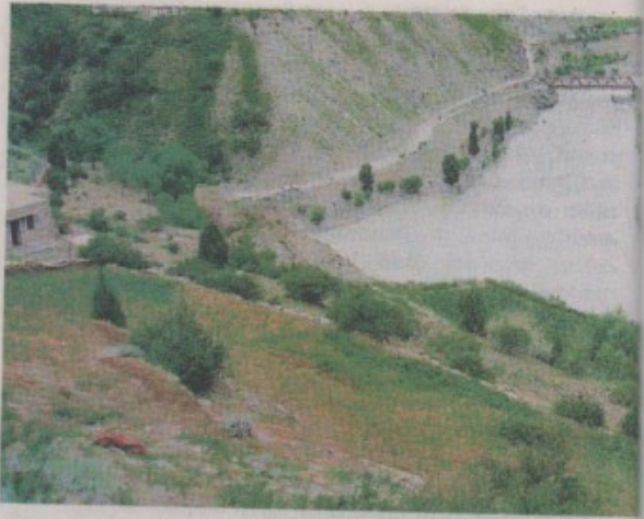
ഡാകിനിമാരുടെയും യോഗികളുടെയും നാടായ ഗർഷയിലേക്കുള്ള തീർത്ഥാടനത്തിലൂടെ സാധ്യമാകുന്നതു നമ്മുടെ ശരീരവും മനസ്സും ഉൾപ്പെടുന്ന മുഴുവൻ സുഖത്തിന്റെയും ചൈതന്യസമാഹരണമാണ്.

ഡാകിനിമാരുടെ ഹൃദയഭൂമി, ഗർഷ, ഇന്നത്തെ ലാഹുൾ ആൻഡ് സ്പിതി എന്നൊക്കെ വിളിക്കുന്ന ഹിമാചൽപ്രദേശിലെ ഈ ജില്ല ആധുനിക ചൈതന്യത്തിന്റെ നിറകൂട്ടമാണ്. ഡാകിനിമാരുടെയും യോഗികളുടെയും നാടായ ഗർഷയിലേക്കുള്ള തീർത്ഥാടനത്തിലൂടെ സാധ്യമാകുന്നതു നമ്മുടെ ശരീരവും മനസ്സും ഉൾപ്പെടുന്ന മുഴുവൻ സന്തോഷത്തിന്റെയും ചൈതന്യസമാഹരണമാണ്. ആ ശക്തിസ്രോതസ്സിനെ പല തലങ്ങളിലൂടെ അനുഭവിച്ചറിയാനും ഈ പ്രപഞ്ചത്തിന്റെ ചലനാത്മകമായ വാഹകരാകാനും ഇതു നമ്മെ പ്രാപ്തരാക്കുന്നു. വൃജയാനപാരമ്പര്യത്തിൽ ഇത്തരമൊരു തീർത്ഥാടനം, സാക്ഷാത്കാരത്തിലേക്കുള്ള യാത്രയുടെ ആഴമേറിയ തലങ്ങളിൽ പ്രവേശിക്കുവാൻ അധികാരമുള്ള യോഗികൾക്ക് തികച്ചും ആവശ്യമാണ്. പക്ഷേ, ആ തലങ്ങളിൽ എത്തിപ്പെടാൻ